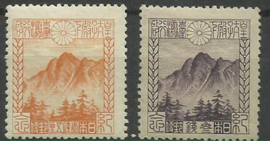
1923年4月16日 日本皇太子訪臺灣 首日發行新高山郵票