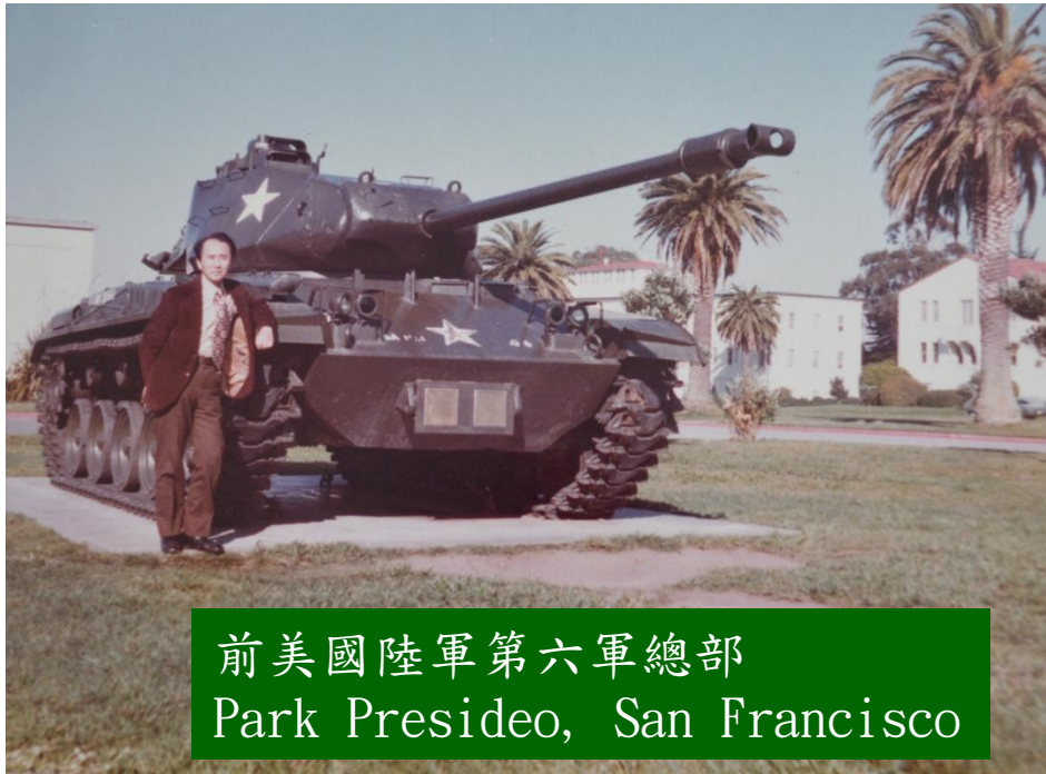
前美國陸軍第六軍總部 Park Presideo, San Francisco