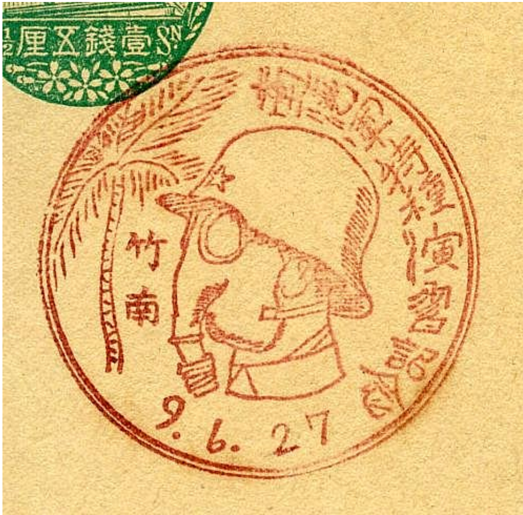
昭和9年6月27日 臺灣軍特種演習紀念 苗栗