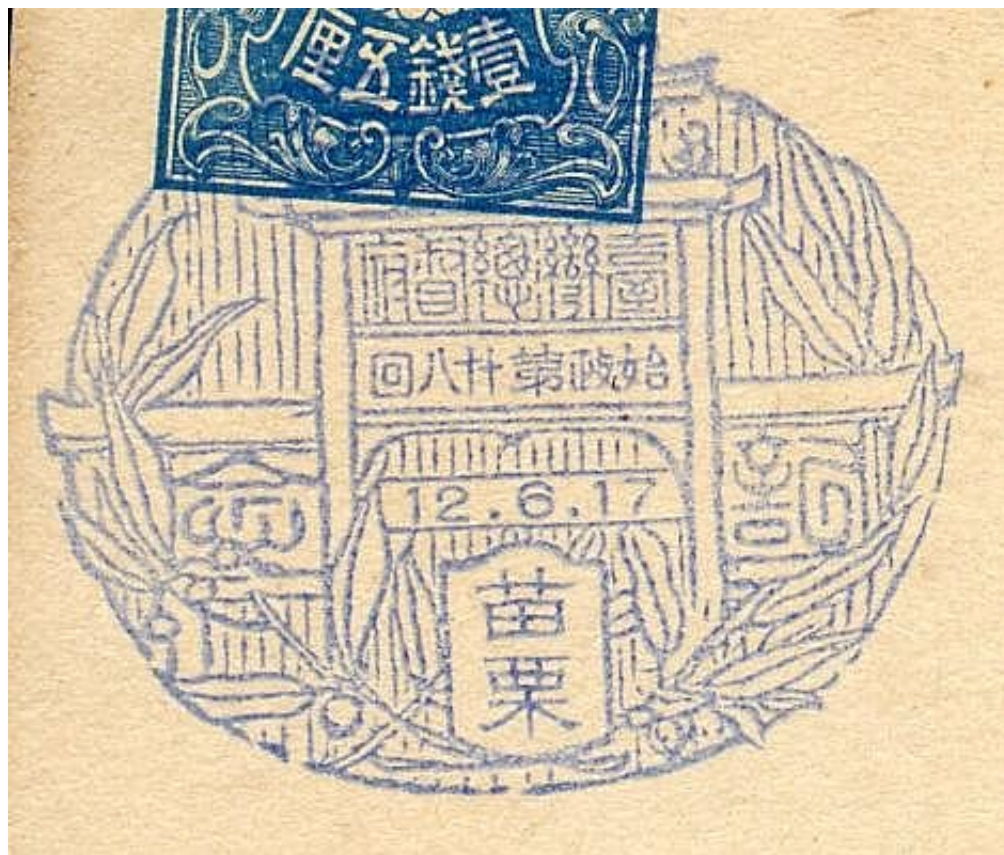
大正14年6月17日 臺灣總都府始政第參拾回紀念 三叉