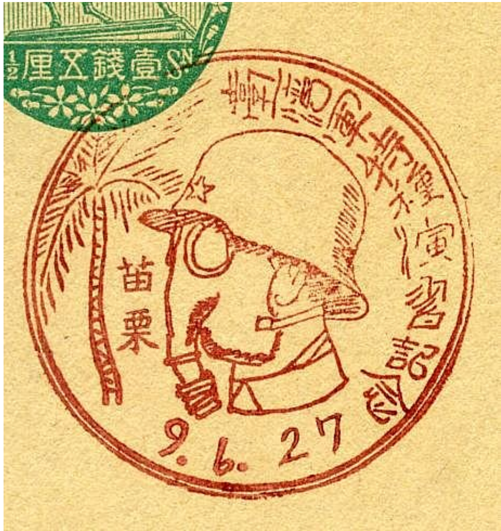
昭和10年11月22日 地方總選舉紀念 大湖