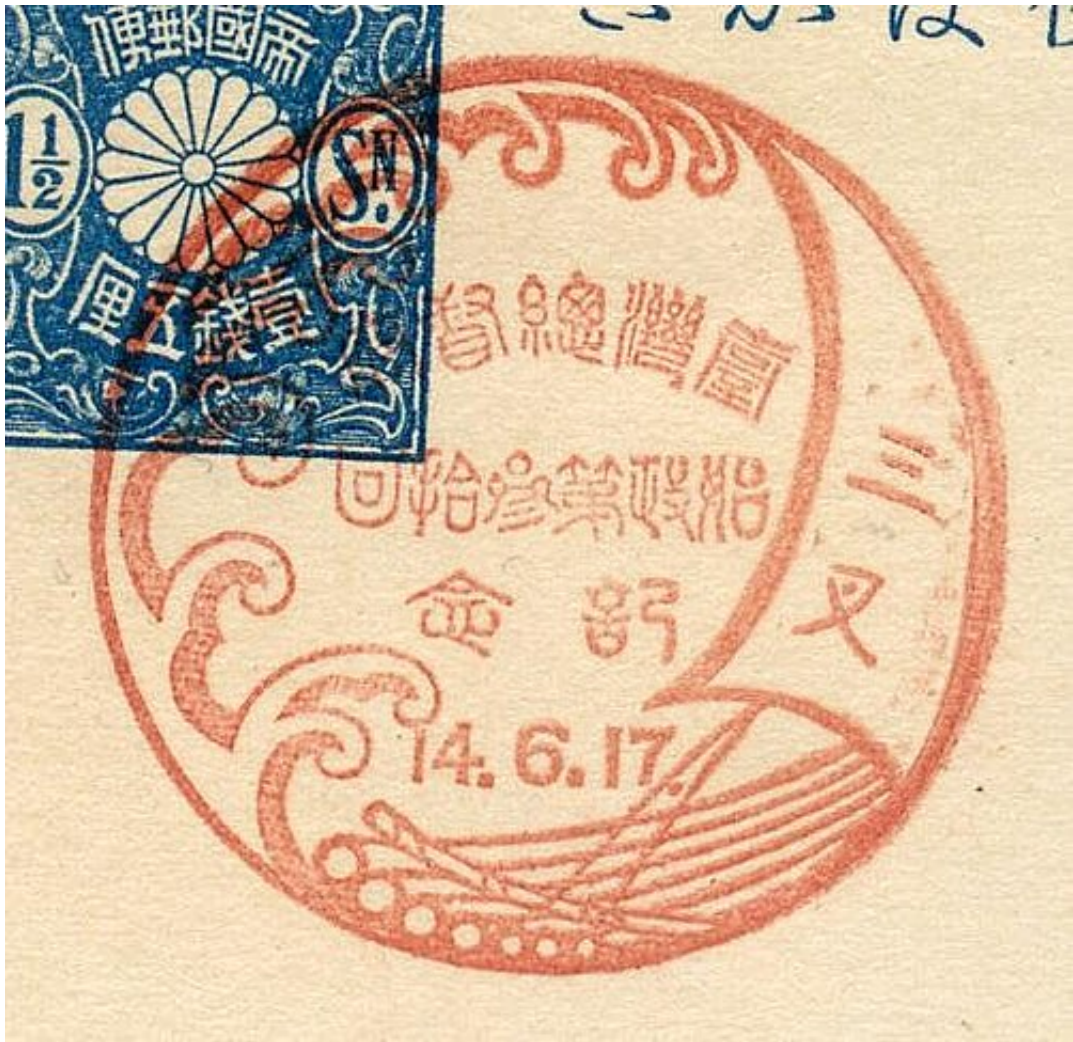
昭和9年6月27日 臺灣軍特種演習紀念 竹南