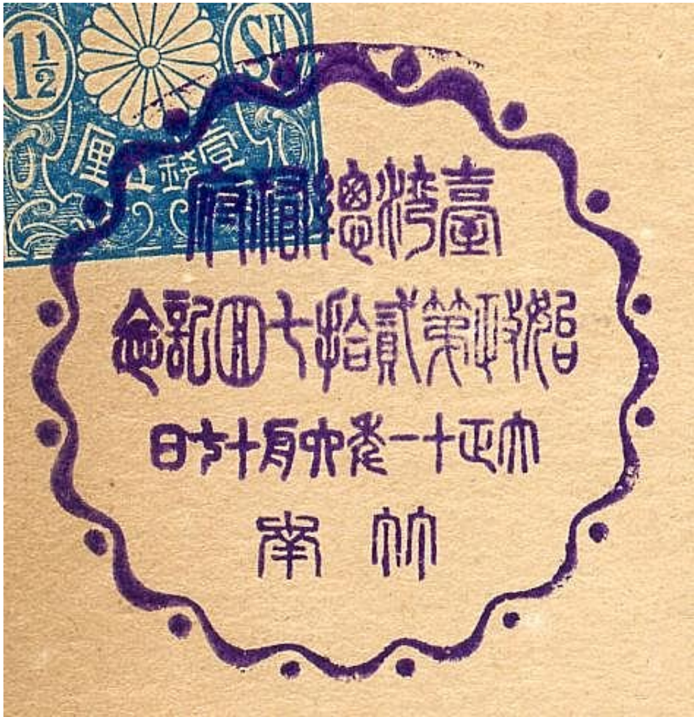
大正11年10月10日 海岸線鐵道開通紀念 通霄