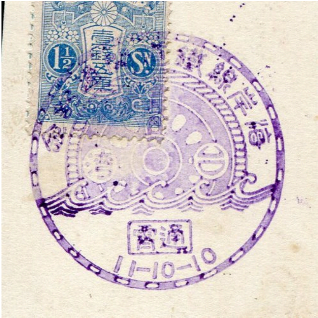
大正12年4月16日 皇太子殿下本島行啟紀念 苗粟