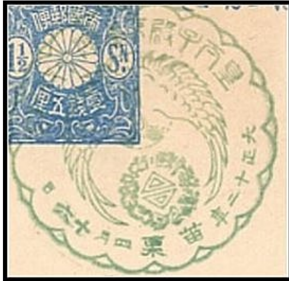
大正12年6月17日 臺灣總都府始政第十八回紀念 苗栗